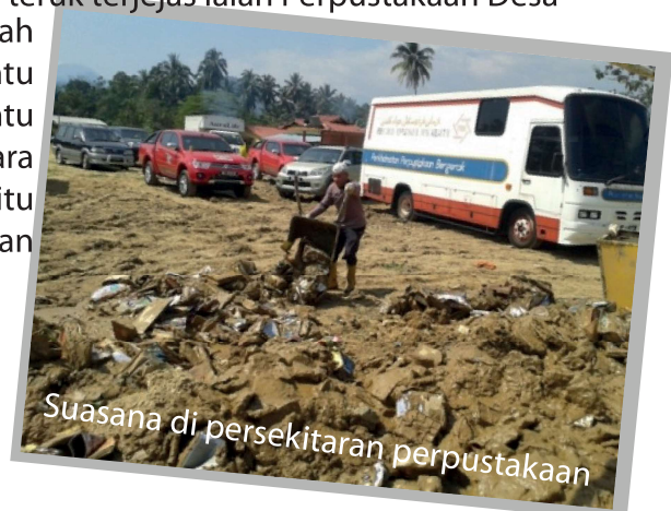
Suasana di persekitaran perpustakaan

Kejadian banjir besar yang melanda negeri Kelantan pada penghujung tahun 2014 yang lalu menyebabkan hampir keseluruhan negeri Kelantan menjadi lumpuh. Antara kawasan yang teruk terjejas ialah kawasan Kuala Krai, Machang, Kota Bharu, Gua Musang, Tanah Merah dan Tumpat. Bencana banjir ini juga menyebabkan beberapa buah perpustakaan cawangan dan desa di negeri Kelantan telah ditenggelami oleh air dan memusnahkan hampir keseluruhan koleksi dan perabut. Antara yang teruk terjejas ialah Perpustakaan Desa (PNM) Kemubu, Kuala Krai. Bagi memulihkan keadaan, PPAK telah mendapatkan bantuan daripada pelbagai pihak untuk membantu membersihkan perpustakaan desa ini. Antara pihak yang membantu membersihkan perpustakaan yang terlibat ialah Perpustakaan Negara Malaysia (PNM) ibu pejabat dan cawangan Perlis. Disamping itu kakitangan PPAK turut bersama berganding bahu membersihkan perpustakaan desa tersebut.