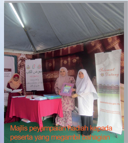
Majlis penyampaian hadiah kepada peserta yang mengambil bahagian