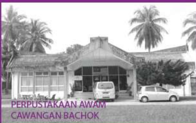
PERPUSTAKAAN AWAM CAWANGAN BACHOK