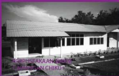
PERPUSTAKAAN AWAM CAWANGAN CHIKU 1