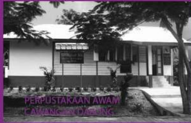
PERPUSTAKAAN AWAM CAWANGAN DARANG