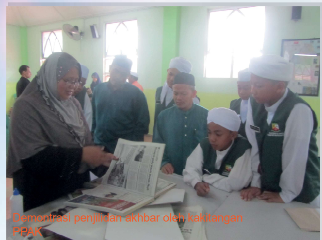
Demonstrasi penjilidan akhbar oleh kakitangan PPAK

Kursus pengurusan perpustakaan diadakan bagi memberi pengetahuan tentang pengurusan perpustakaan seperti proses katalog, pemuliharaan buku dan sebagainya kepada pelajar dan guru-guru yang terlibat. Kursus ini telah diadakan pada 16 jun 2015 bertempat di dewan Maahad Tahfiz Bustanul Arifin, Tumpat.