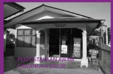
PERPUSTAKAAN AWAM CAWANGAN SALOR