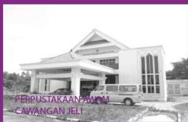
PERPUSTAKAAN AWAM CAWANGAN JELI