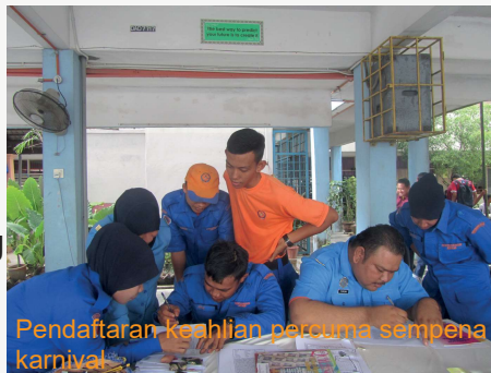
Pendaftaran keahlian perempuan sempena karnival

Pelbagai aktiviti membaca dan promosi telah diadakan sempena karnival edu-ria yang telah diadakan pada 11 april 2015 yang berlangsung Perempuan Pasir Mas.