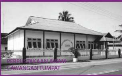
PERPUSTAKAAN AWAM CAWANGAN TUMPAT