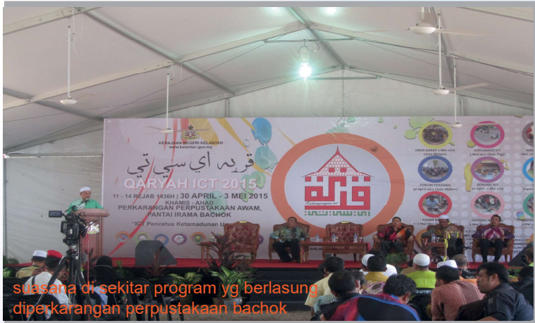
suasana di sekitar program yg berlangsung diperkarangan perpustakaan bachok