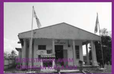
PERPUSTAKAAN AWAM CAWANGAN KUALA KRAI