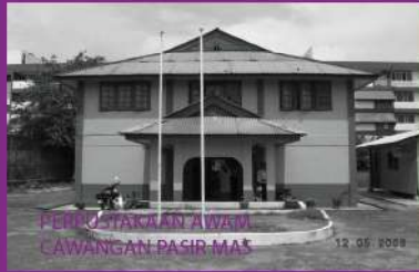
PERPUSTAKAAN AWAM CAWANGAN PASIR MAS